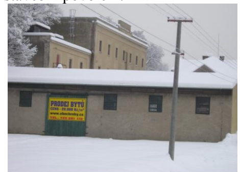
Mlýn v lednu 2010

Na akci již máme pravomocné stavební povolení.